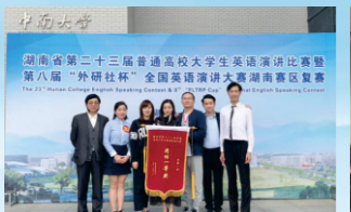
我校学子在湖南省第二十三届普通高校毕业生英语演讲比赛中斩获3项一等奖。