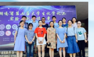
我校学子在湖南省第七届大学生化学化工实验与创新设计竞赛中获得一等奖4项。