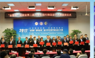
我校学子荣获2017年“金鑫杯”湖南省第二届大学生现代物流设计大赛决赛一等奖3项。