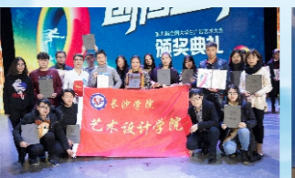
我校学子在2017年第九届全国大学生广告艺术大赛中获等级奖11项，其中一等奖2项，二等奖6项，三等奖3项。