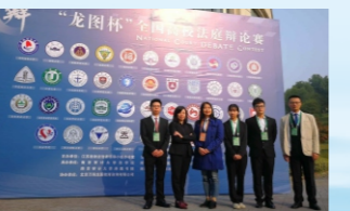
长沙学院法学院代表队在第一届全国高校法庭辩论赛从42支队伍中脱颖而出成功闯进“十六强”。